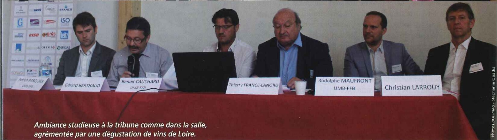
Ambiance studieuse à la tribune comme dans la salle, agrémentée par une dégustation de vins de Loire.